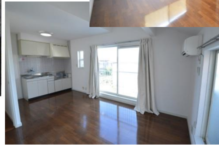
リビング・キッチン