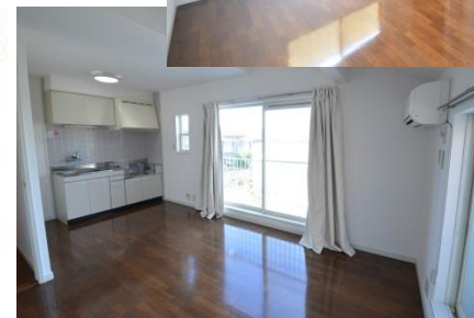
リビング・キッチン