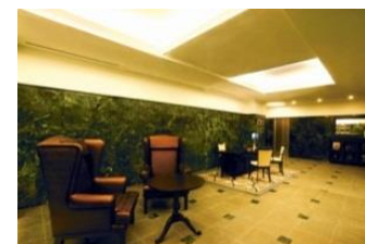
※1年未満の解約は違約金有り